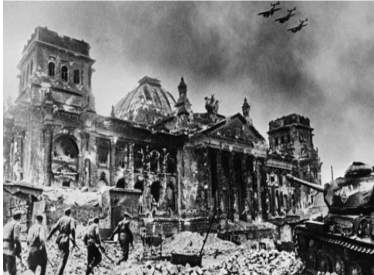
Heute anscheinend vergessen: Großschadenslage Mai 1945