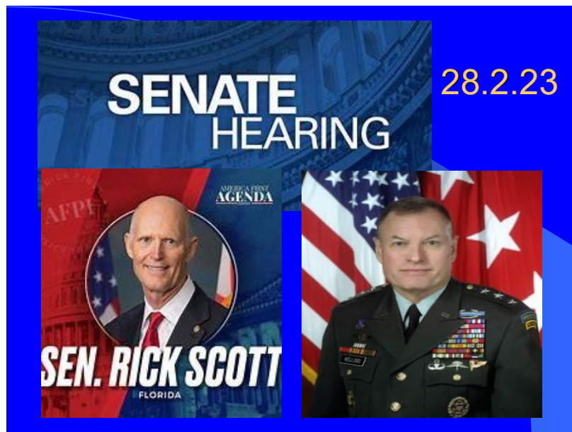
Senatsanhörung von Ex-General Keith Kellogg am 23.Februar 2023

Dem Senator schwärmte der Ex-General vor: „Wenn man einen strategischen Gegner besiegen kann und dabei keine US-Truppen einsetzt, ist man auf dem Gipfel der Professionalität , denn wenn man die Ukrainer siegen lässt, ist ein strategischer Gegner vom Tisch, und wir können uns auf das konzentrieren, was wir gegen unseren Hauptgegner tun sollten, und das ist im Moment China... wenn wir dabei scheitern, ... müssen wir vielleicht einen weiteren europäischen Krieg führen, das wäre dann das dritte Mal.“ (34) Nun, die USA scheitern gerade in der Ukraine!