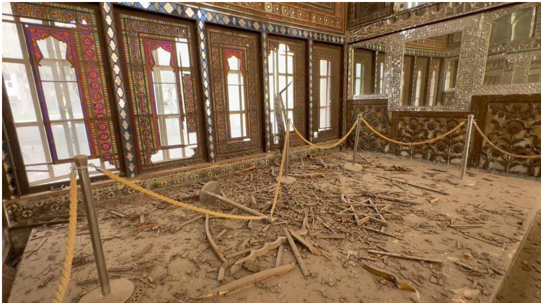
The 400-year-old Golestan Palace reportedly sustained damage from a nearby missile blast in March

https://www.theartnewspaper.com/2026/04/15/more-than-200-cultural-figures-sign-statement-criticising-international-response-to-destruction-of-iran-heritage