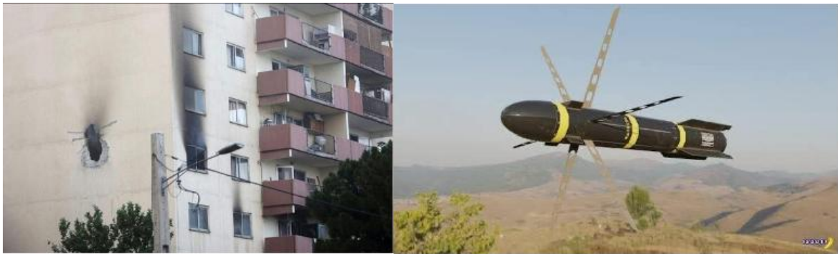
Hellfire Rakete – links: Ergebnis; rechts: Hellfire Rakete

Sie lieferten Geheimdienstinformationen. Sie betankten die israelischen Bomber über Syrien, was für sich allein eine massive Verletzung des Völkerrechts darstellt. Wie man hört, ist inzwischen auch der deutsche Kriegsgeist erwacht, so dass die deutsche Regierung ebenfalls seine Flugzeuge schickt.