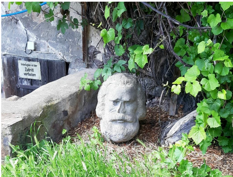
Es könnte Karl Marx gewesen sein ... Gefunden im Hof der Kunsthochschule Burg Giebichenstein in Halle an der Saale, am 12. Juni 2024

Wie Marx und Engels die reale Psyche in ihrer Lehre verdrängten