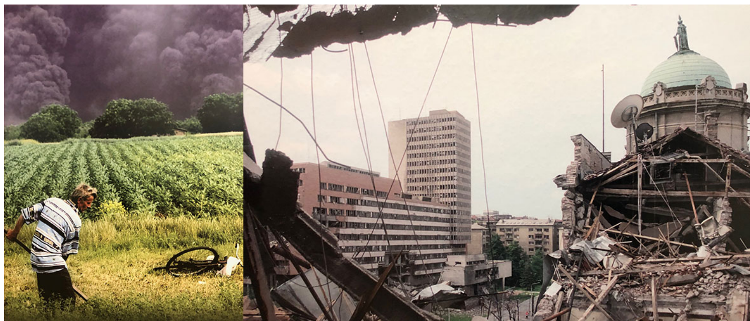
Ausstellungsbilder während der Gedenkveranstaltung (Wolfgang Effenberger)