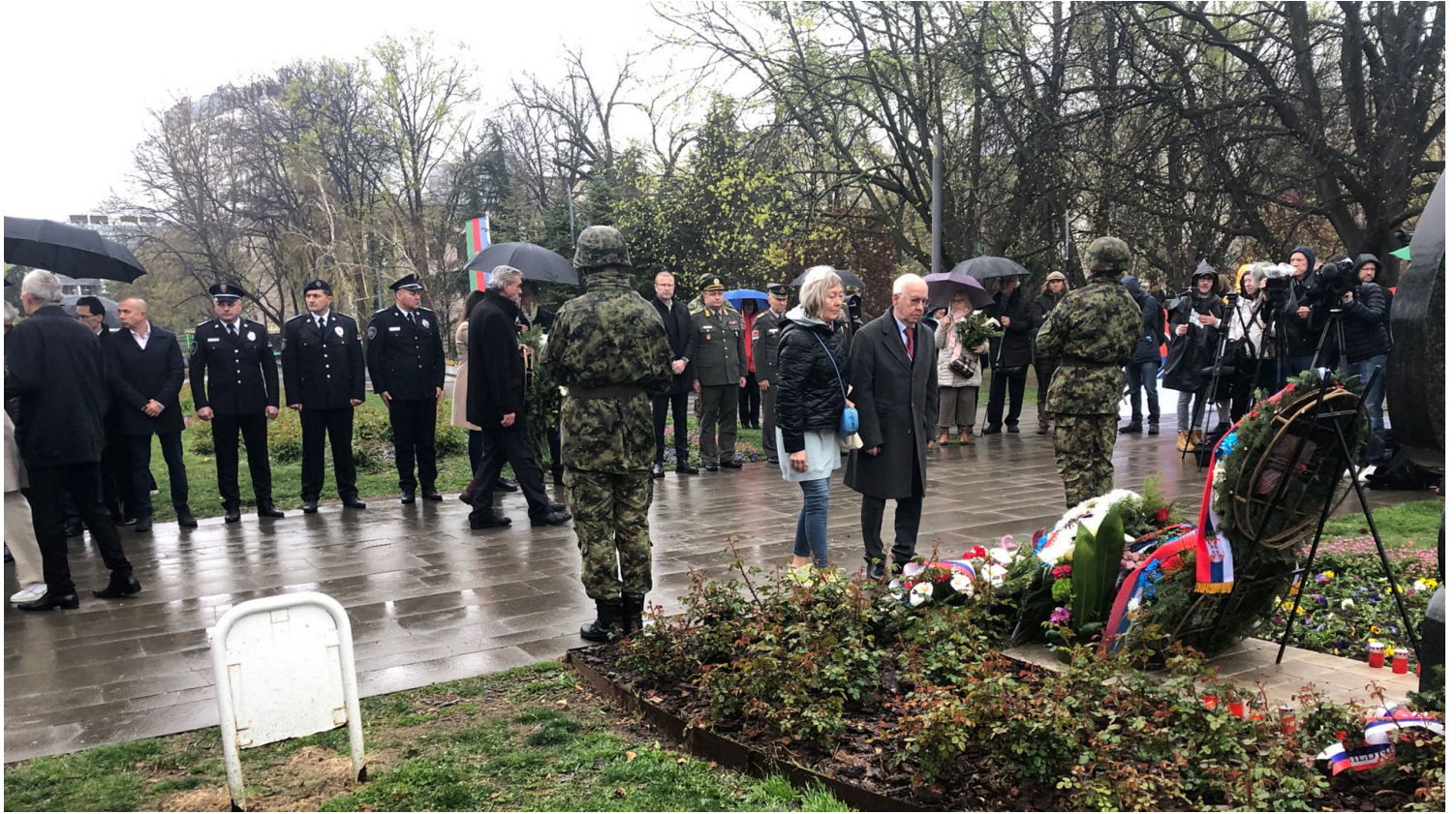
Jury Starovatikh, ehemaliger Bürgermeister von Wolgograd (Stalingrad) im Gedenken (Wolfgang Effenberger)