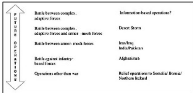
Figure 2-3. Range of Future Operations

Von den Hilfsmaßnahmen in Somalia/Bosnien/Nordirland über den Kampf (gegen Infanterie) in Afghanistan bis hin zum Kampf zwischen komplexen, anpassungsfähigen Kräften und gepanzerten Mech-Kräften wie im Irak (Operation "Desert Storm"). Im Herbst 2014 stellte der Befehlshaber des "U.S. Army Training and Doctrine Command" (TRADOC), Vier-Sterne-General David. G. Perkins, das Nachfolgepapier "TRADOC 525-3-1 Win in a Complex World 2020-2040" vor.