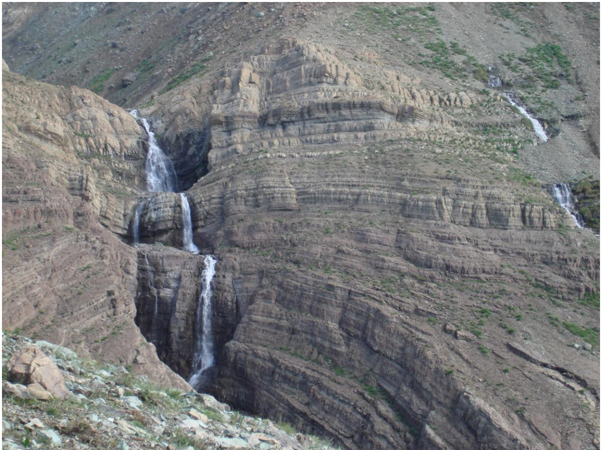
Atash Kooh / Iran